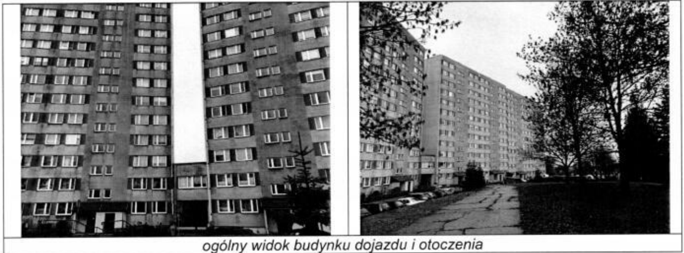
ogólny widok budynku dojazdu i otoczenia

Przedmiotowy budynek wybudowany został pod koniec lat 70-tych XX wieku, jest to obiekt 12 – kondygnacyjny, podpiwniczony, wykonany w technologii wielkiej płyty.